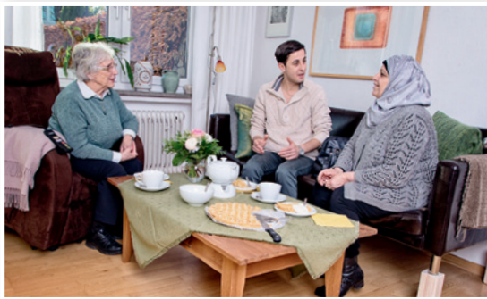
Wohnzimmer: Stolperfallen wie rutschende Läufer, Teppichkanten und im Weg liegende Kabel vermeiden.