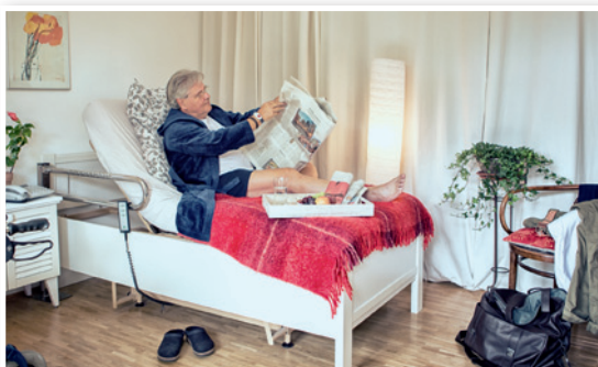
Schlafzimmer: Mehr als ein Ort zum Schlafen – Wohlfühlen bei Tag und Nacht.