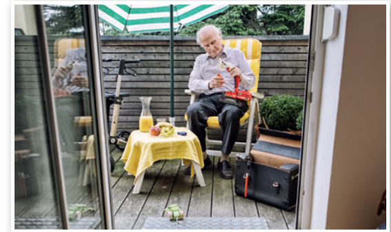
Balkon und Terrassen: Der Außenbereich muss leicht und sicher zugänglich sein.

Das Team der Beratungsstelle Wohnen, Stadtteilarbeit e.V.