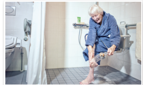
Bad: Der Umbau zu einem barrierefreien Bad erfordert Aufwand. Aber der lohnt sich.