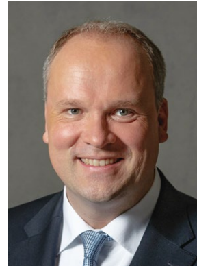
Christoph Göbel Landrat des Landkreises München

In herzlicher Verbundenheit Ihre Landräte