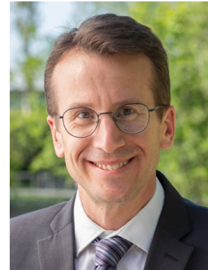
Stefan Frey Landrat des Landkreises Starnberg